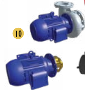
Sprühpumpe ohne Gehäuse