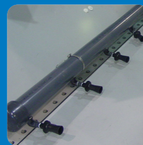
Патрубки очистки поддона**