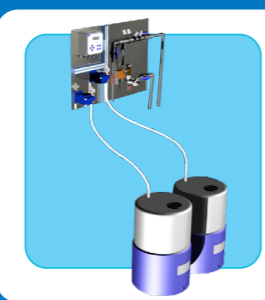
Автоматическое управление сливом ВСР