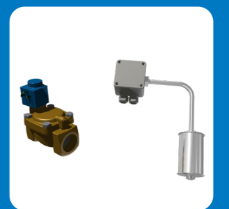
Комплект электроуправления уровнем воды