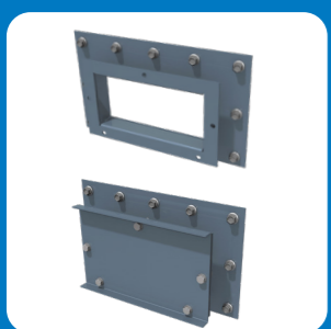
Люк для промывки