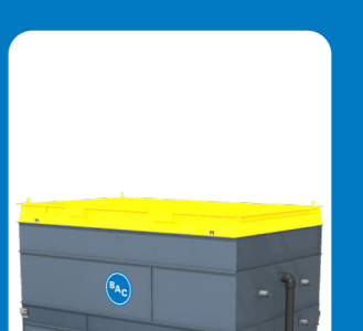
заслонки принудительного закрытия**