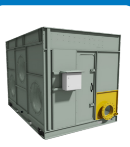
соединение удаленный отстойник