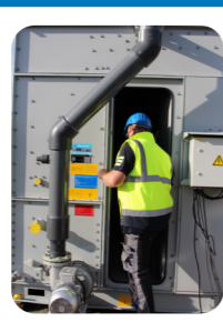
входная дверь противоположная*