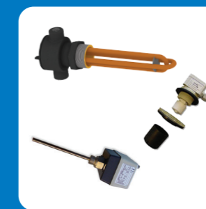
Комплект подогрева поддона