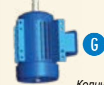
Количество может изменяться в зависимости от типа установки.