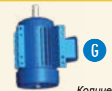
Количество может изменяться в зависимости от типа установки.