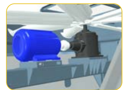
i Привод редуктора (опция)